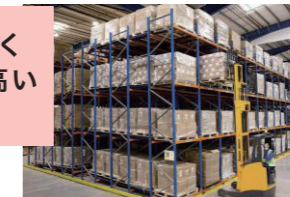
※ Warehouse image